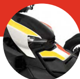
Heritage White IV